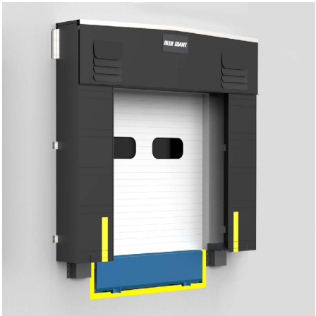
BG600 ABRI À CADRE EN MOUSSE

Pour une valeur et des performances optimales, le BG600 peut être fabriqué à partir de nos tissus haut de gamme résistants (veuillez consulter le tableau pour connaître les matériaux, les poids et les couleurs disponibles).