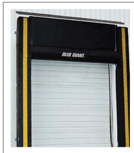
Sello de andén de almohadilla de cabecera ajustable BGDSA