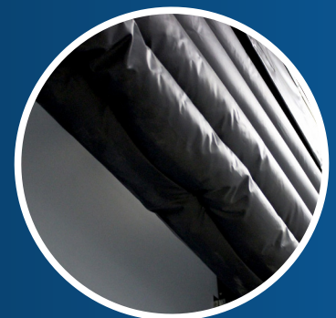
Opcional: Bolsa de aire superior de colocación directa adicional