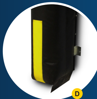
Franjas guía de 24" (610 mm)