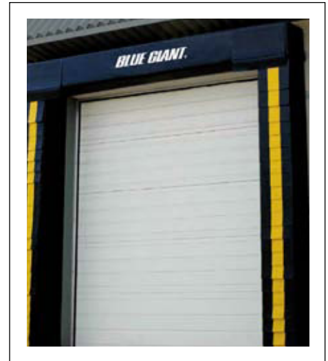
Sello de andén con almohadilla de cabecera fija BGDSF