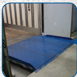
Niveleur de quai