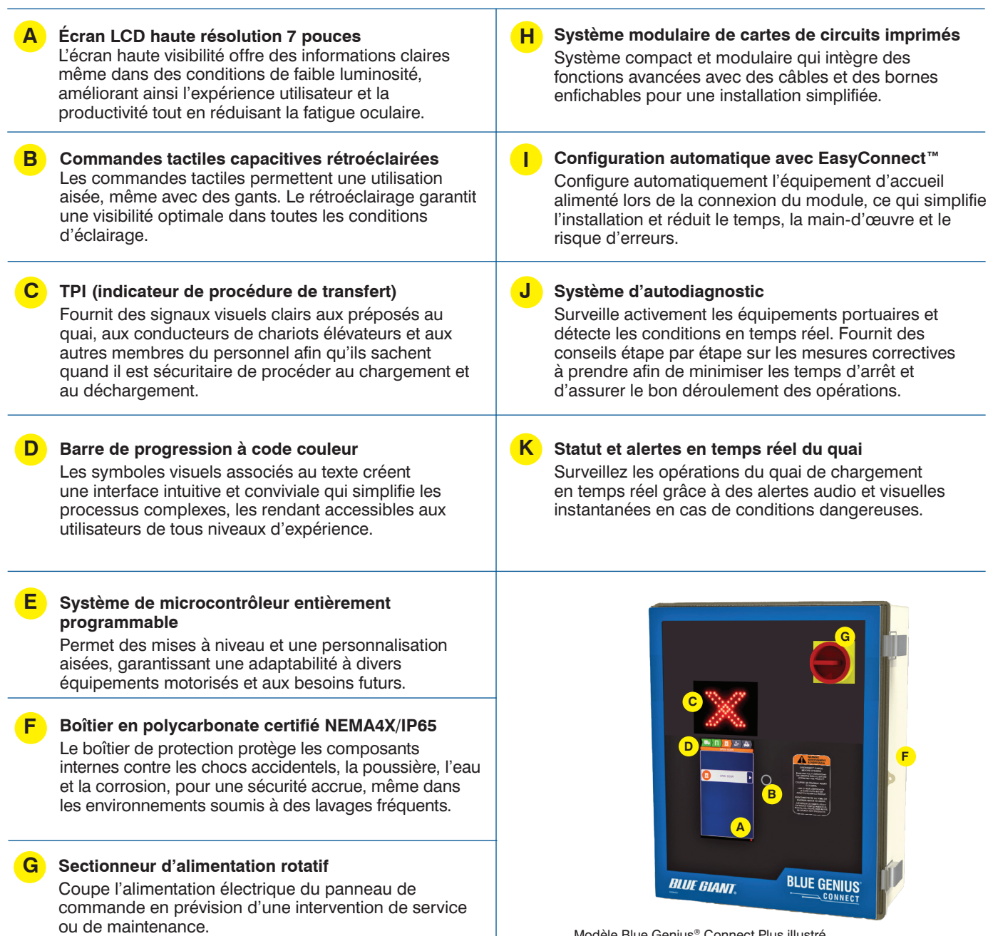
Modèle Blue Genius® Connect Plus illustré.