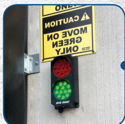
Feu de signalisation