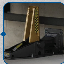
Dispositif de retenue pour véhicules