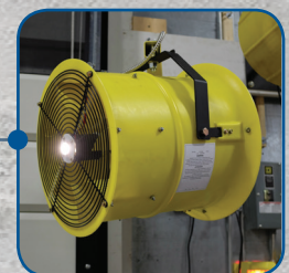
Ventilador con luz de rampa