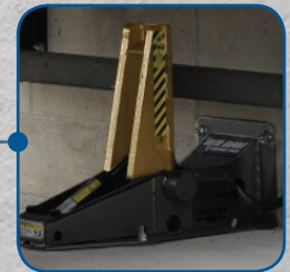
Retenedor de vehículo