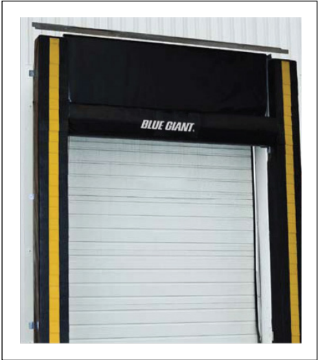
Joint de quai à coussin de tête réglable BGDSA