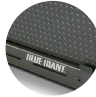
Gris acorazado (Battleship Grey)