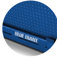
Azul (Standard Blue)

Blue Giant ofrece una serie de opciones de colores de pintura de alta calidad para mejorar tanto la durabilidad como la estética de su equipo de andén. Elija entre nuestros acabados característicos Azul (Standard Blue), Gris acorazado (Battleship Grey) y el elegante color Negro brillante (Black Gloss), diseñados para un desempeño duradero.