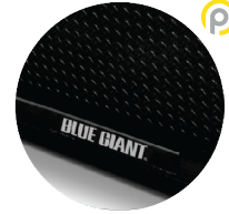
Negro brillante (Black Gloss)