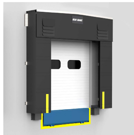
Abrigo con estructura de espuma BG600

Para obtener el máximo valor y rendimiento, el BG600 se puede fabricar con nuestras telas de durabilidad prémium (consulte la tabla para conocer los materiales, pesos y colores disponibles).