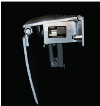
Posición de tráfico almacenada