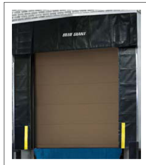
Abrigo de andén estacionario BGDSHS