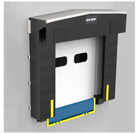
Abrigo de andén con estructura de espuma BG670

Para obtener el máximo valor y rendimiento, el BG670 se puede fabricar con nuestras telas de durabilidad premium (consulte la tabla para conocer los materiales, pesos y colores disponibles).